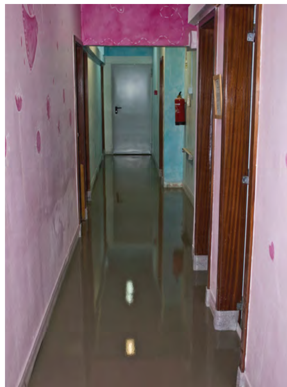
Lisboa, 24 de Setembro, Ajuda de Berço