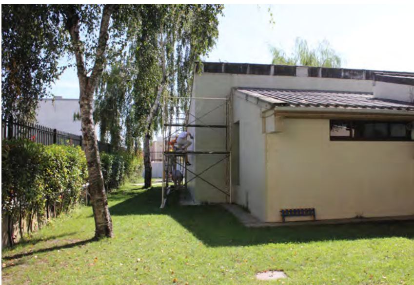
Porto, 10 de Setembro, Assus (Associação de Solidariedade Social do Seixo)

Todo o esforço desta equipa foi compensado com a alegria de ver estes espaços como novos! A Saint-Gobain Weber agradece a todos os clientes que os visitaram durante os dias da renovação, ajudando também a que esta acção se tornasse possível.