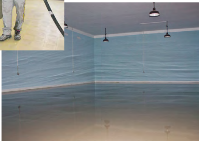
Chaves, 16 de Julho, Centro de Convívio de Idosos

Renovar é com a Weber. Renovar é renoweber.