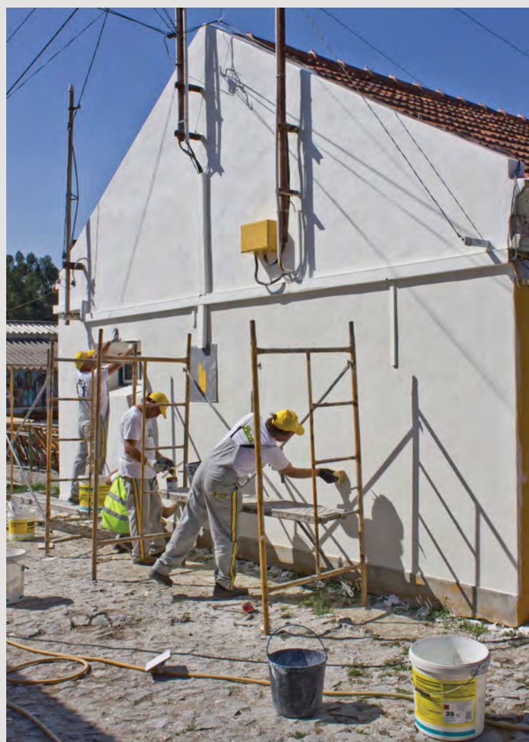
Évora, 23 de Julho, Cercidiana