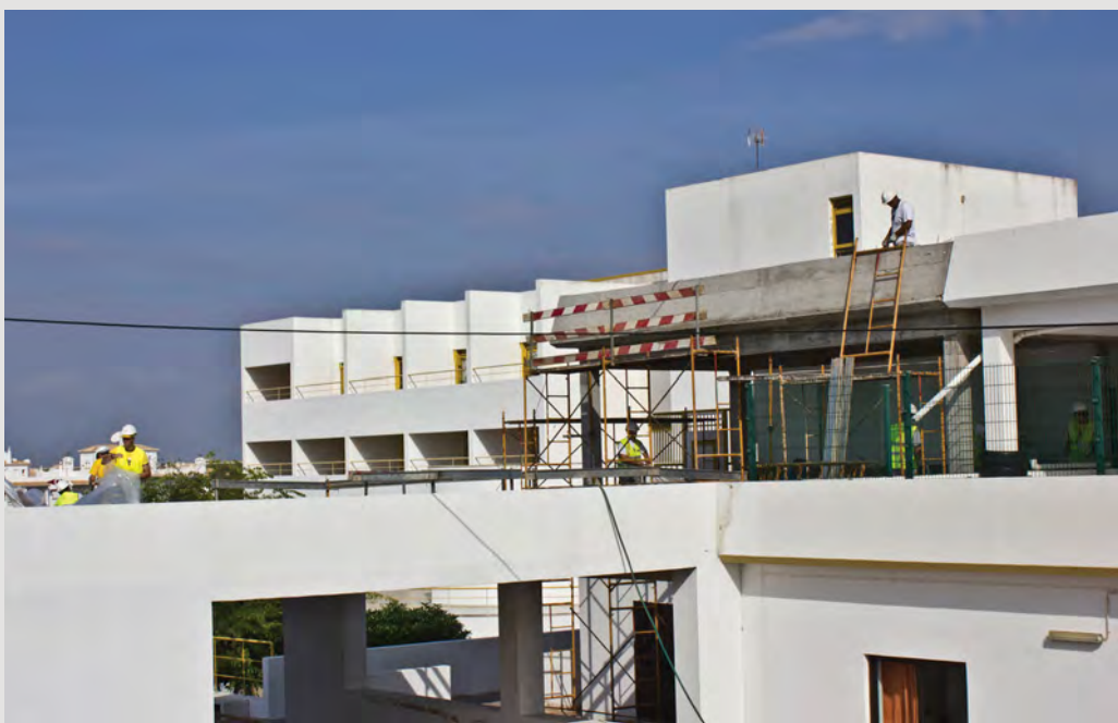
Lagoa, 17 de Setembro, Centro Popular de Lagoa