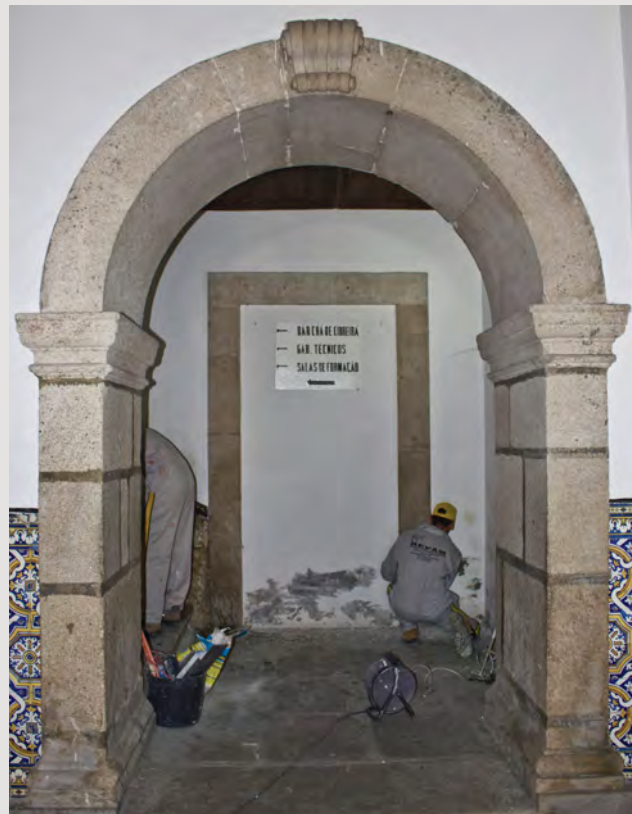
Lamego, 30 de Julho, Apitil (Associação pela Infância e Terceira Idade)