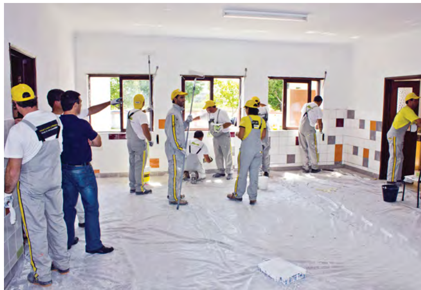
Ilhavo, 2 de Julho, Obra da Criança