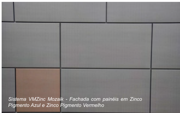
Sistema VMZinc Mozaik - Fachada com painéis em Zinco Pigmento Azul e Zinco Pigmento Vermelho