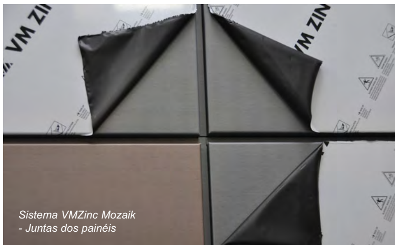
Sistema VMZinc Mozaik - Juntas dos painéis

Os dois sistemas consolidam os desígnios da arquitectura contemporânea, quer na construção nova, quer na reabilitação.