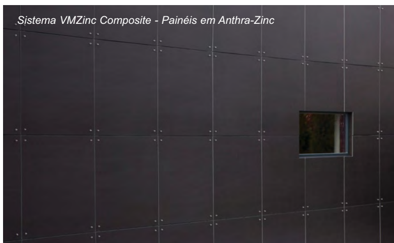
Sistema VMZinc Composite - Painéis em Anthra-Zinc